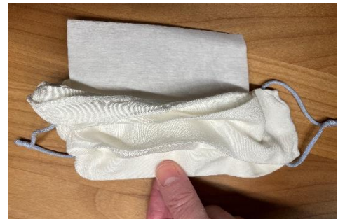
Filter stets geklemmt halten