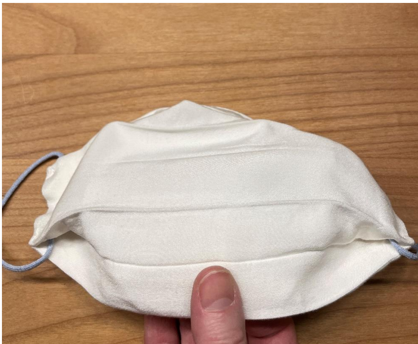
Maske ist vollständig zurückgestülpt